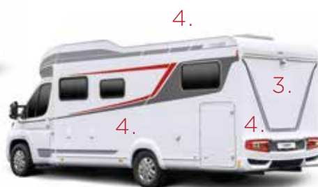
(hier afgebeeld is de Tourer H 730 G)