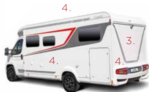
(hier afgebeeld is de Tourer T 660 G)